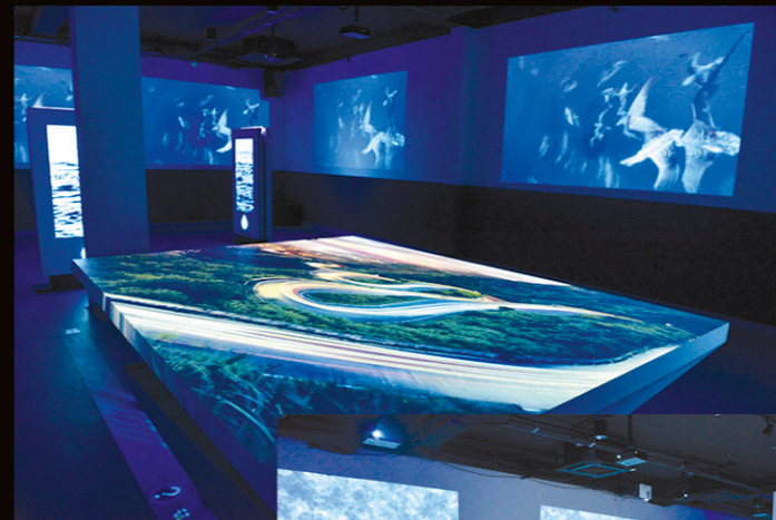
Sala de Exposição Temporária (Caixa D'Água)