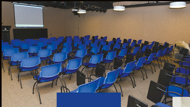
Auditório e Acolhimento