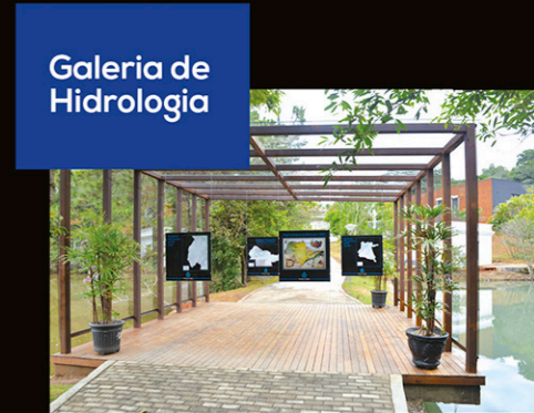
Galeria de Hidrologia