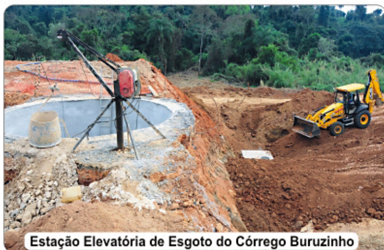
Estação Elevatória de Esgoto do Córrego Buruzinho