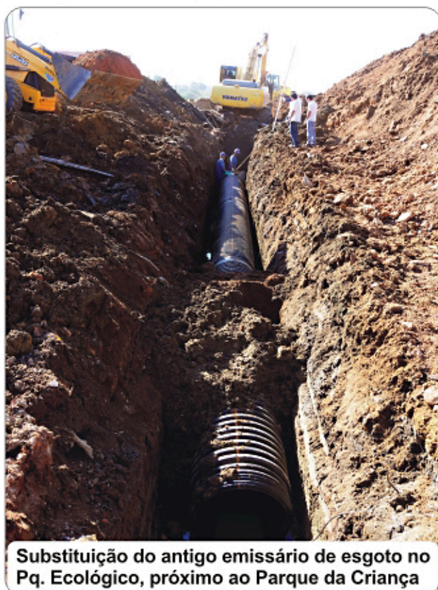
Substituição do antigo emissário de esgoto no Pq. Ecológico, próximo ao Parque da Criança

O esgoto afastado das indústrias, comércios e residências tem que ter destino adequado. É por isso que o SAAE investe em grandes obras de saneamento.