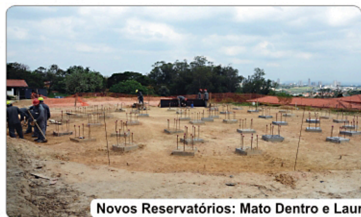
Novos Reservatórios: Mato Dentro e Lauro Bueno de Camargo; 10 milhões de litros