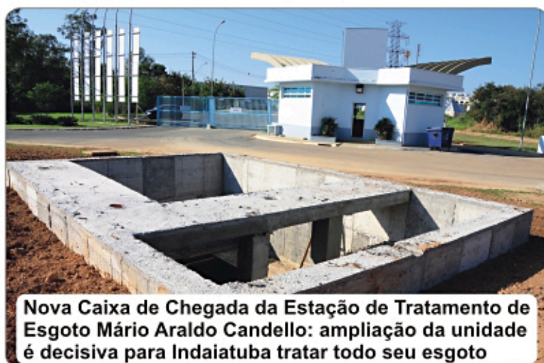
Nova Caixa de Chegada da Estação de Tratamento de Esgoto Mário Araldo Candello: ampliação da unidade é decisiva para Indaiatuba tratar todo seu esgoto