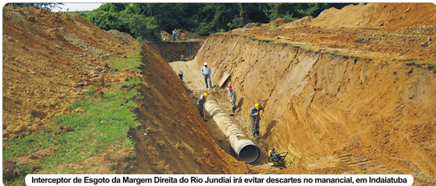
Interceptor de Esgoto da Margem Direita do Rio Jundiáí irá evitar descartes no manancial, em Indaiatuba

O esgoto afastado das indústrias, comércios e residências tem que ter destino adequado. É por isso que o SAAE investe em grandes obras de saneamento.